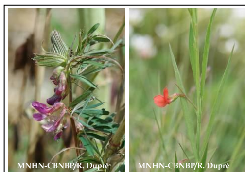
Vesce striée ( Vicia pannonica var. purpurascens ) et Gesse à graines rondes ( Lathyrus sphaericus )

Sur la base de cette première version de la liste « à dire d'expert », et en croisement avec le niveau de menace de la liste rouge régionale des espèces végétales menacées, il a été proposé de créer des niveaux de priorité de conservation. Cette hiérarchie suit la même gradation que celle utilisée pour le plan national d'action pour les messicoles. Il existe ainsi trois niveaux avec 1 représentant le niveau de priorité maximal et 3 le niveau de priorité minimal. Les taxons non revus depuis 1990 sont notés D (présumés disparus). Les espèces de niveau 1 feront l'objet d'un bordereau « espèce à enjeux », permettant de relever les conditions stationnelles ainsi que l'effectif de la population (voir annexe 2).