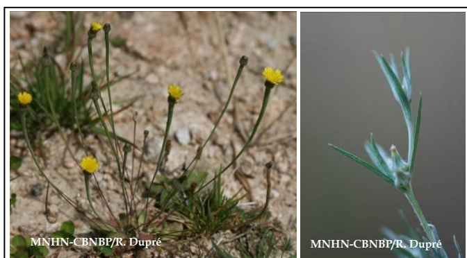
Arnoseris naine ( Arnoseris minima ) et Cottonnière de France ( Logfia gallica )

Les espèces de mouillères et de jachères n'ont pas été intégrées à cette problématique.